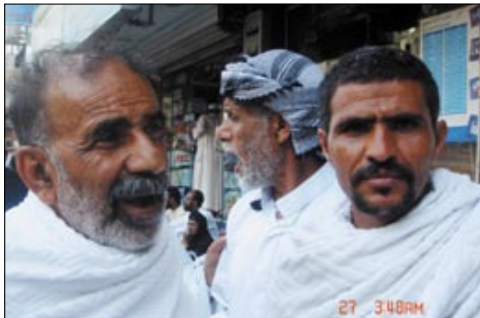
● حجاج يمنيون ممن سكنوا الفندق المحترق

الرقابة من قبل وزارة الأوقاف على الوكالات لتوفير