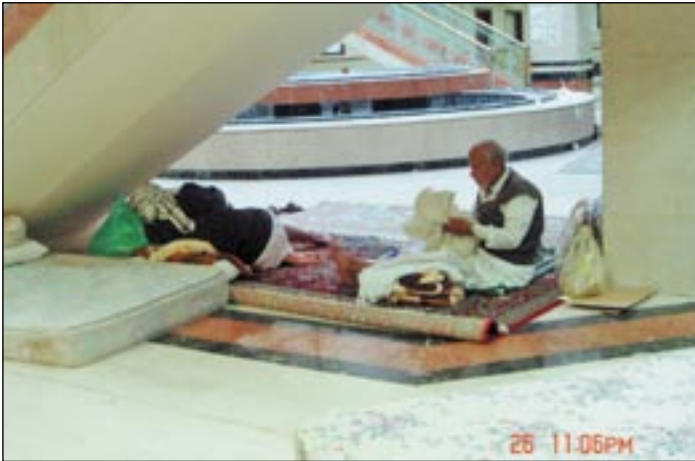
● .. وأيضاً تحت سلالم الفندق