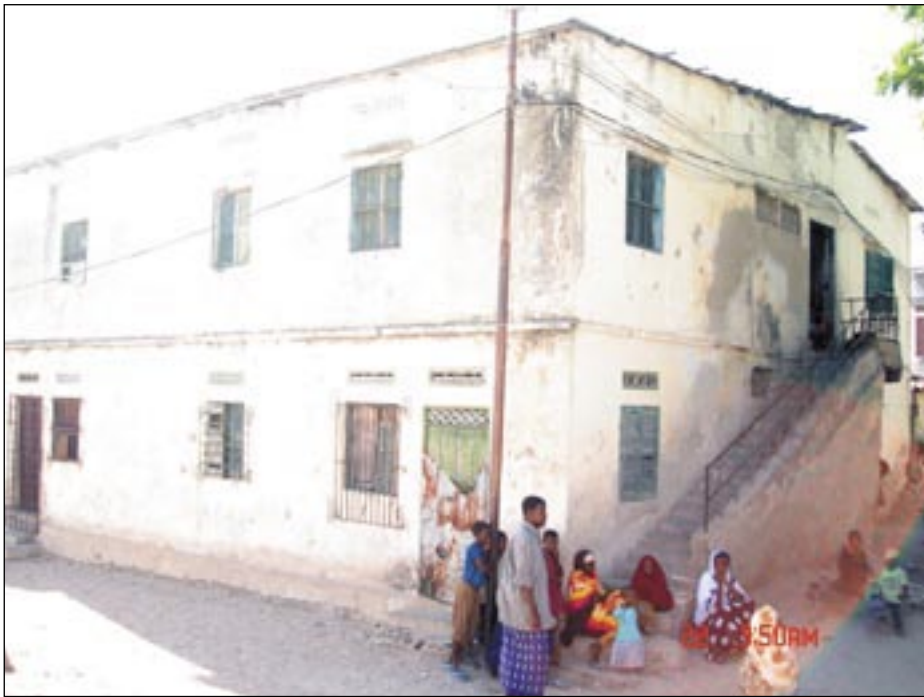
• «بار حبيب» يستقبل الزبائن في مقديشو فيما صاحبه تآكل من صدقات المحسنين في عدن. (22 ديسمبر 2006) ت: جلال الشرعبي

أن ذلك لم يمنعه من اعتماد وسائل قاسية مع معارضي صديقه الديكتاتور سياد بري. أحد مصادر «النداء» بدأ وانقأ من وجود دوافع ثارية لدى الجناة الذين قوضوا كيانه.