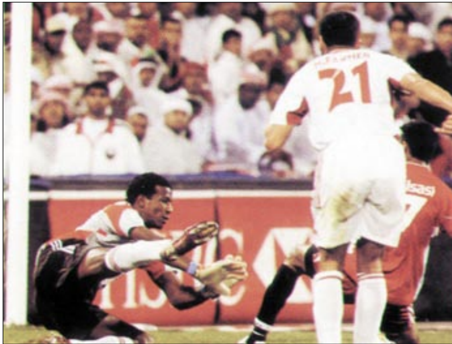
● هدف أحمر في المرمى الأبيض