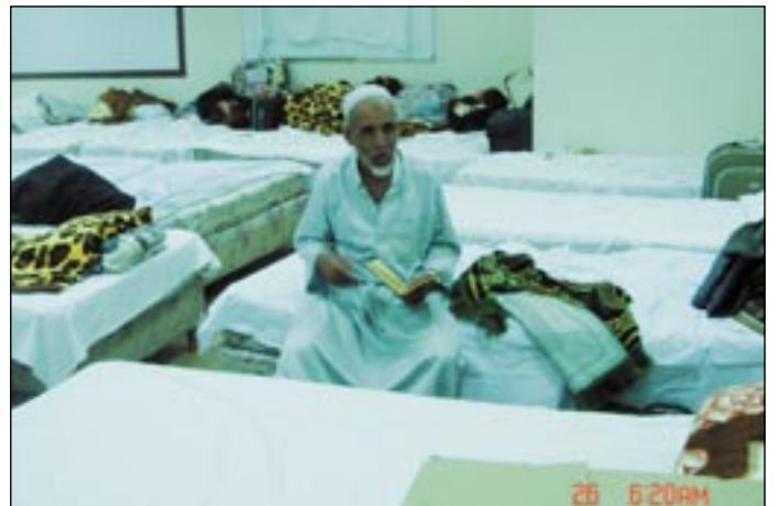
● أكثر من 29 حاجاً في غرفة واحدة!