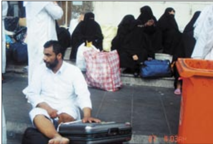
● حجاج يمنيون يفترشون الشارع عقب الحريق

امام مشكلة الباصات، فلم يسلم منها أحد، ورغم أن بعض الوكالات توجه سهاها تجاه البعثة اليمنية على اعتبار أنها تدفع اجرة الباصات قبل أشهر، فإن مصادر في البعثة اليمنية تؤكد أن المشكلة تعود إلى الجهات السعودية التي أخلفت الوعد في تمكين البعثة اليمنية من جميع الباصات التي وعدوا بها. ويظل الأمر غير مؤكد بالنسبة لنا، هل حدث تلاعب أم لا؟