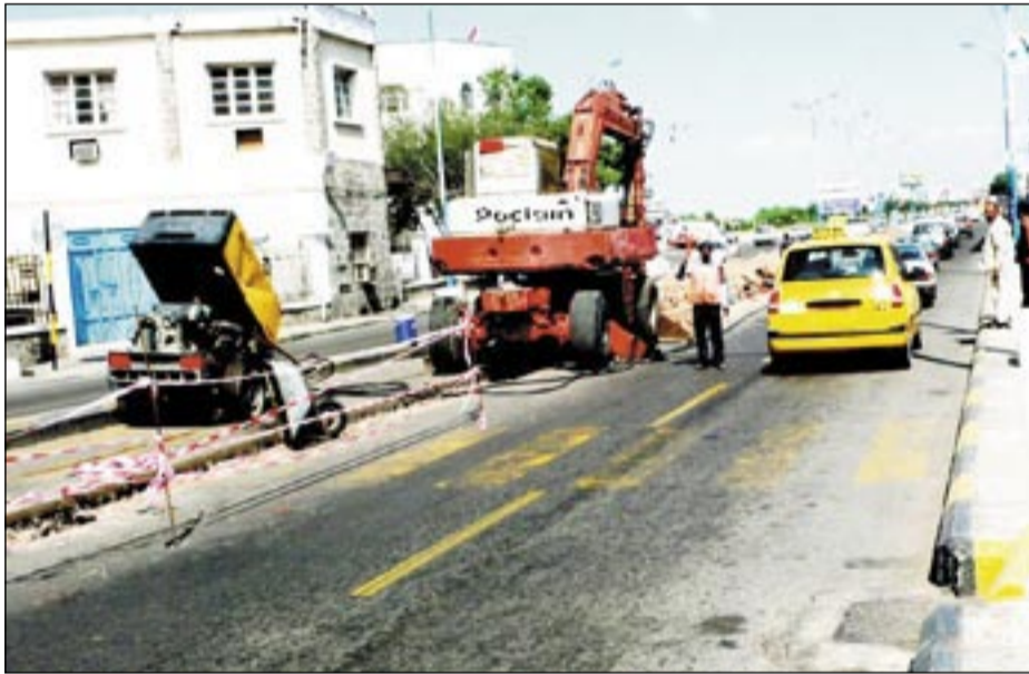
• ... وأخرى ما بعد السفلة

هل ينتظر سجانوه أن تأتي أمه الفقيرة بصرة دراهم وتنتثرها بين يدي القاضي الذي سئمت مراجعته كل أسبوع؟! «لو عندي فلوس أو مال أو ذهب بابيعه وأخرج ولدي بس منين.. منين!».