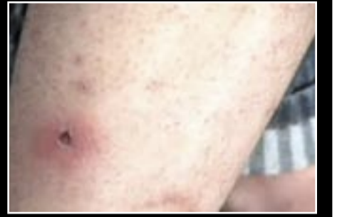
● جسد.. أم مطهأة سجاثر 19