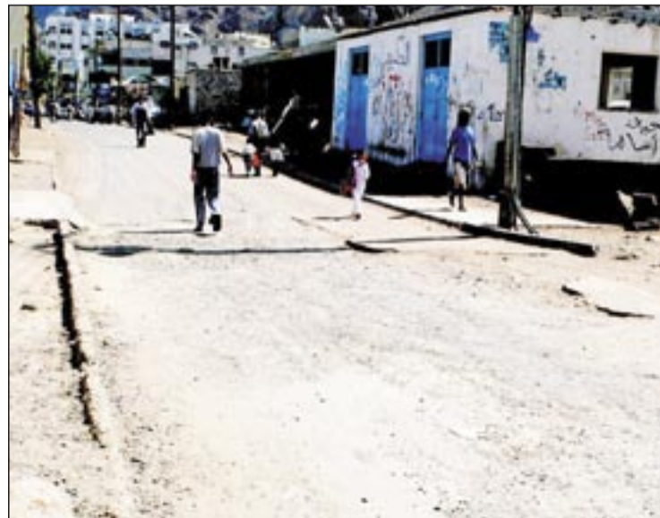
• الرئيس لا يمر من هنا!!

المسؤولية هنا تقع على عاتق الجهة التي تشرف على المشاريع، والتي تغطي في سبات عميق. أحد الظرفاء علق على هذه الإشكالية بقوله: «الموضوع ليس غياب الاشراف ولكن في تعمد ترك بعض الفجوات حتى يعتمد لها مشروع جديد وإلا كيف يستمر النزيف