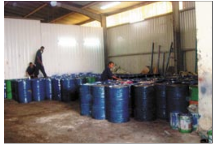
● في المزاد

لم يستطع أحد من الزائرين أن يخفي علامات الاندهاش والاستغراب الممزوجة بالغضب والحزن مع ساعة دخولهم أحد معامل إعادة تكرير الزيوت بمدينة عدن. منظر العمال حفاة الأقدام ومكسوين بالسواد في مكان خطر كهذا، الذي راوه، جعل الجميع يصف الوضع بالمأساة والكارثة. لمكان كان من المفترض أن يكون موقعاً لتنقية الزيوت العادمة لإعادة استخدامها وللحفاظ على البيئة، فتحول إلى مأساة حقيقية لعمال يبيحثون عن لقمة العيش وسط سموم قد توصلهم إلى طريق اللاعودة.