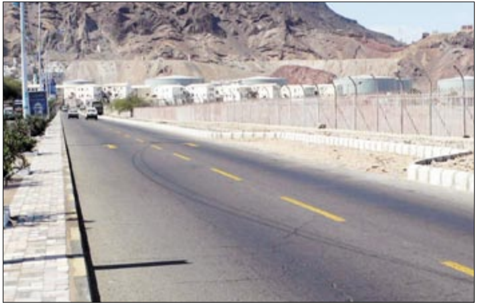
• تحديث خدمات جديدة