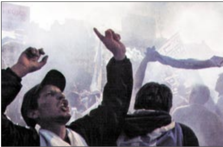
• من فيلم «إيفا بيرون»

العشرة بعد تبادل لإطلاق النار في مطار المدينة بين الخاطفين والقناصة الألمان. لتنتج السينما الإسرائيلية بعد ذلك فيلم «غرفة حمراء» عام 1984 والذي يحكي قصة الجندي «كوهين» الذي يقع في أسر إحدى الفصائل الفلسطينية المقاومة للاحتلال الإسرائيلي للبنان في صيف 1982، حيث تظهر مشاهد الفيلم صورة الجندي مكبلاً داخل أحد الخبائض وإلى جواره المقاتلون الفلسطينيون وهم يتابعون جميعاً عبر شاشة التلفزيون أحداث مونديال كرة القدم القادمة في اسبانيا عام 1982 والتي يصورها الفيلم بمجموعة هتافات عنصرية حاقدة تصدر من قبل المقاتلين الفلسطينيين أثناء مشاهدتهم للمباريات. فيما يجمع المشهد الأخير للفيلم وحده مشاعر بين الجندي الإسرائيلي وأسريه ضد الفريق الألماني الذي يمثل: «المؤامرة» بالنسبة للفلسطينيين (ضد المنتخب الجزائري في تلك البطولة)، و«الحرق» بالنسبة للإسرائيليين؛ والذي خسّر أمام إيطاليا في نهائي البطولة. ويختتم الفيلم بلحظة هزلية تتمثل في تحرير الأسير الإسرائيلي بعد مقتل خاطفيه من قبل فرقة كوماندوز إسرائيلية.