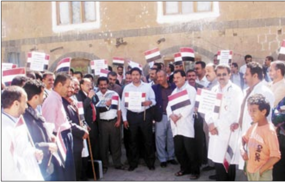
● شاعر يستدر الحماس بقصيدة