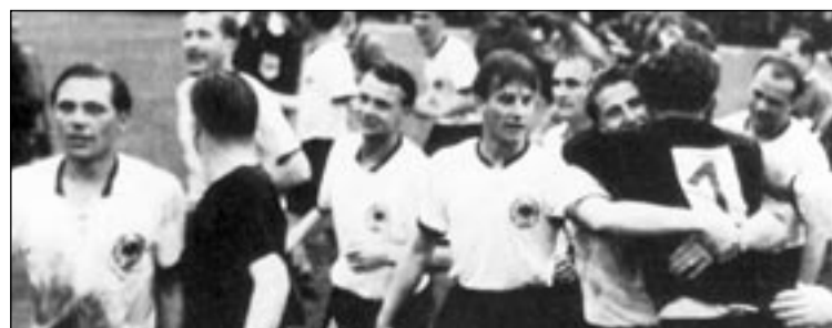
• من فيلم «معجزة بيرن»

الأمريكي الجنسية الذي انتزع بطولة العالم للوزن الثقيل عام 1958 من البطل الروسي «أندريه تورمانوف» في العاصمة موسكو. فيما واجهت السينما الروسية غريمها هوليوود عبر فيلم «عربة ترايسكو» الذي أنتج عام 1981 ويتحدث عن قصة شاب روسي غر يقترح رياضة سباق القوارب ويظهر في نهاية مقاطع الشريط وهو يظفر بالنصر من نظرائه الغربيين. كما قدمت السينما الهندية (هوليوود) فيلم «تمريرة مزوجة» عام 2003. وهو من بطولة الممثلة «كريشما كابور» و«بوبي دول» نجل الممثل الشهير «دار مندرا» والفيلم يجسد مسيرة كفاح المنتخب الهندي «الكريكيت» اللعبة الأكثر