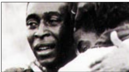
• بيله في «الهروب للنصر»

للشخصية الألمانية المملوءة بالتعالي والتي تجبرك بنفس الوقت على احترامها. وعلى خط نكريات المجد المنتشية بزهو شديد، قدمت السينما الأمريكية مطلع الثمانينات السلسلة الثلاثية من أفلام «روكي» التي جسدها الممثل سلفستر ستالون والتي تتناول مسيرة بطل الملاكمة «روكي مانشيانو» الإيطالي الأصل