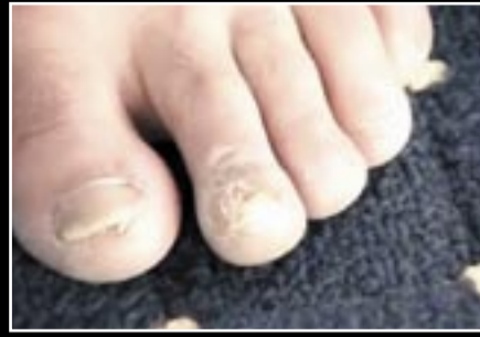
● خلع أضافر