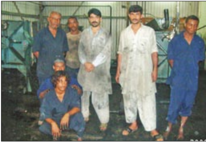
● وهؤلاء في الخطر!

العربية ومنها اليمن. تقررت الورشة منذ أربع سنوات -حسب مدير المركز الإقليمي لاتفاقية بازل، وذلك بعد أن عرض مندوب اليمن الأوضاع السيئة للزيوت والبتترول وأشار الدكتور مرتضى في حديثه له «الذء» بأن الكل قد اجمع على أن هناك أبعادا كثيرة للموضوع أكثر من مجرد نقل تكنولوجيا وهو الوعي البيئي العام على مستوى الجماهير والفنيين والإداريين ومتخذي القرار.