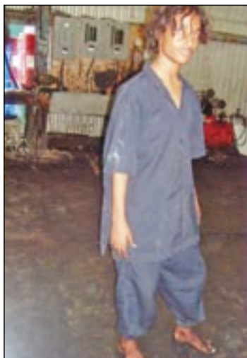
● أعلى درجات الوقاية

وأضاف «غفر» أن أنواع الأشعة الثلاثة: إشعاع ألفا «نواة ذرة الهليوم»، إشعاع جاما (أشعة كهرومغناطيسية ذات طاقة عالية)، إشعاع بيتا، إذا ما تجاوزت الكمية التي يتعرض لها الجسم الجرعة المسموح بها فإن ذلك إما أن يقتل الخلايا الحية مباشرة أو يؤدي إلى ما يسمى بالآثار التحويرية أي تحوير في عمل الخلية وبالتالي تكاثرها تكاثرا سرطانيا. أما فيما يتعلق بالبيئة فإن الأراضي أو المياه الملوثة بهذه النفايات المشعة تخرج عن الاستثمار لمدة تزيد عن مائة سنة على الأقل. فعلى سبيل المثال، زراعة الأراضي الملوثة