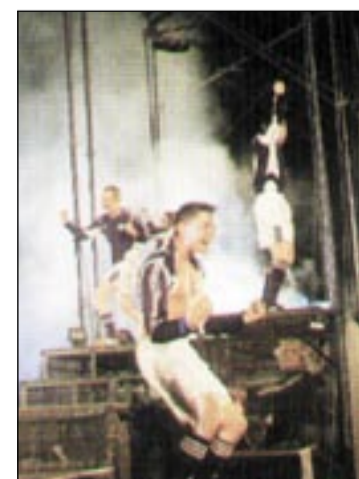
• من فيلم «عربة ترايسكو»

ليس هذا فقط، بل وظفت السينما العالمية العديد من نجوم الرياضة واقدمتهم داخل كواليس الفن السابع، للإستفادة من شعبيتهم، حتى تستفيد الأفلام منها عند عرضها بتحقيق أعلى مدخول من شبك التذاكر والترويج لعارضها، حيث برزت قامات رياضية عملاقة في عالم السينما منهم الصيني الراحل «بروسلي» ومواطنه «جاكي شان» و«جت لي» والأمريكي «شك نوريس» والهولندي «فان دام» في ألعاب الدفاع عن النفس، إضافة إلى برون نجم كمال الأجسام الأمريكي الجنسية النمساوي الأصل «أرنولد شوارزنغر» إلى جانب نجمي السلة