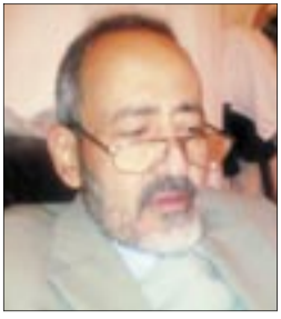
عبدالله سلام الحكيمي

والعدالة والتنمية الحكيم هذا هو الذي شكل الجسر الأمين والأمن الذي أوصله إلى حكم وقيادة تلك الدولة العلمانية القائمة على ديمقراطية حقيقية، وذلك تعبيرا عن إرادة الشعب التركي الحرة وخياره الديمقراطي الحر، ولو وجد هذا الحزب، على سبيل الجدول، في بلد غير علماني وغير ديمقراطي لكان من المستحيل عليه أن يصل إلى الحكم إلا عبر عملية انقلابية دموية مدمرة، تجعل منه بشكل تلقائي سلطة حكم ديكتاتوري شمولي قمعي إلى أن تحل محله وبنفس الأسلوب قوة أو حزب آخر، وهكذا في دوامة لا تنتهي ماسيها وكوارثها المساوية، ولو أنه اتخذ موقفاً مناقضاً لموقفه الإيجابي المثمر ذلك كانت تركيا والشعب التركي العظيم اليوم في عالم آخر وفلك مختلف وموقع مغاير تماماً لما هو عليه اليوم من توافق مع مكوناته التاريخية والثقافية والحضارية العميقة الجذور والبالغة الثراء والحوية، ومن نهوض وتطور حضاري شامل.