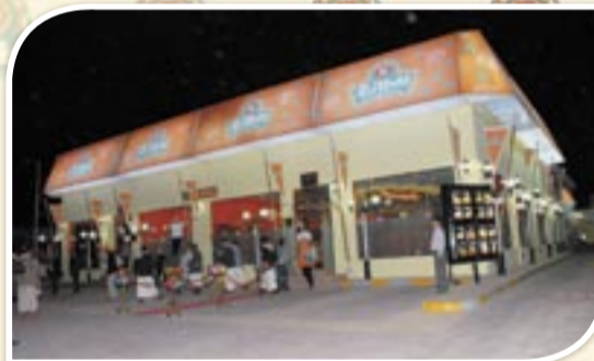
• مبنى الطازج (١) بصنعاء