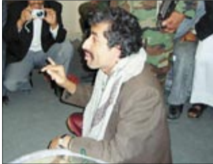
● السجن الذي قام بقطع أصبعه وأذنه