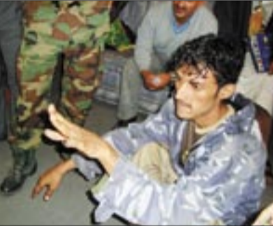
● السجن الذي قام بقطع أصبعه

وعبر عن رفضهم الشديد للنزول عند رغبة هؤلاء مطالباً المحكمة بسرعة إصدار الحكم "لأسبابنا" وأن ظروفنا المالية المعسرة لا تسمح بان نتحمل تبعات المطلة والتسويف ومجازرة غرماً مبسورين. أملين بأن يعينهم السماوي على إحقاق الحق وإعمال القانون الذي لا يرجون سواه.