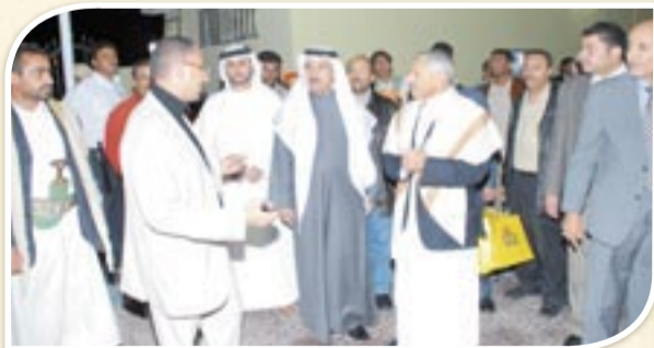
السعودية والسفارة السعودية لدعم الاستثمار السعودي في اليمن.