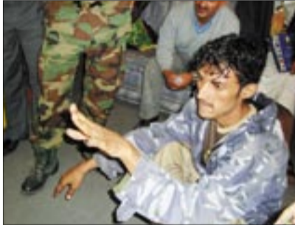
● السجن الذي قام بقطع أصبعه