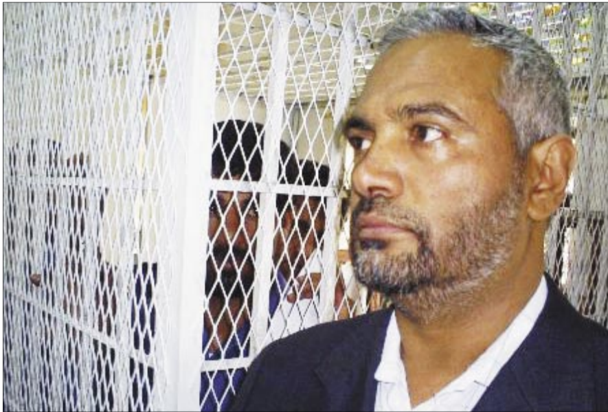
• المقال (إرشيف)

فالأهم منها الآن هو ما أنتم عليه مسؤولون، وليس كيف تضحكون لجيرانكم.