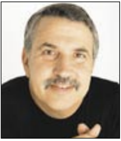
بقلم: توماس فريدمان

انفجر هذا الوضع، في الوقت الذي ترتفع فيه التوترات حول بيع الأسلحة الأميركية إلى تايوان، عليكم بربط حزام الأمان.