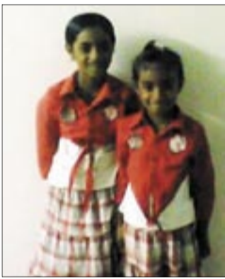
● وابنتاه الصغيرتان

لم يفت بامعلم التأكيد على عدالة القضية الجنوبية. وإن حيا نضالات أبناء الجنوب والفعاليات التضامنية التي يتم إحيائها في رمضان للمطالبة بالإفراج عن المعتقلين على ذمة الحراك الجنوبي، شدّد على الطابع السلمي للحراك، وقال: «لن نتبنا السجنون عن نضالنا السلمي».