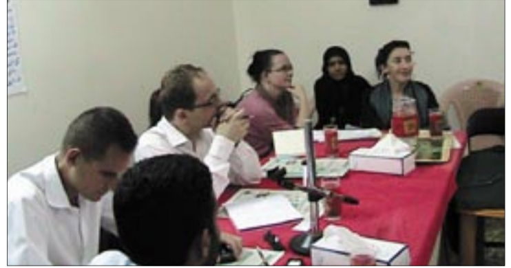
■ "النداء" سماح جميل

استضاف مركز اليمن لدراسات حقوق الإنسان، الجمعة الماضي، في عدن، بعثة الاتحاد الأوروبي الاستطلاعية حول الانتخابات البرلمانية.