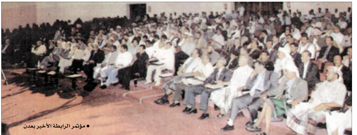
● مؤتمر الرابطة الأخير بـعدن

- نشعر أن الأوضاع العامة يسودها الكثير من القلق والاحتقانات السياسية والاجتماعية. إضافة إلى تردي الحياة المعيشية والاقتصادية لأغلبية أبناء