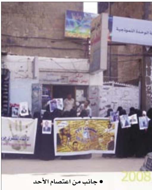
● جانب من اعتصام الأحد