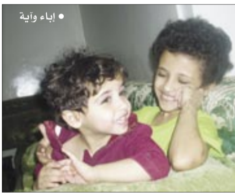
● إباء وآية

الشريك اليمني معني بتقديم قضيتين - على الأقل - في مشروع فيلمين تسجيليين، أحدهما في الغالب سيكون عن الحقوق المهذورة للنساء، والتعسف القانوني. المهمة الصعبة هي اختيار أهم قضيتين من مجمل مواضيع تصلح جميعها لتكون فيلماً قصيراً يعرض في نصف ساعة على الأكثر. هذا هو الجديد الذي يضيفه «الشقائق» خلال الأشهر القادمة للمجتمع الحقوقي.