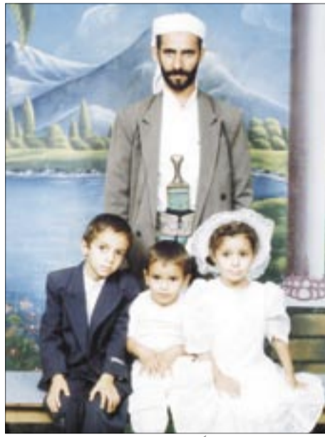
● .. ومؤمناً ظهر أطفاله (1998)