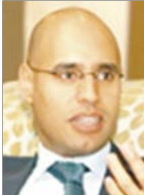
• سيف الإسلام