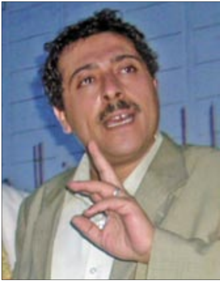
• الأصابع المهتدة بالبتر

وسعدت دولة الربيع النفطية انفلات الغرائز. إن الجمهورية القبلية التي ورثت الإمامة إنما هي إمامة معكوسة، أو مضادة، أسقطت المسوح المذهبية وأخذت تنهل من «قوانين» طاغوتها الخاصة، فتضاعفت قطيعتها مع تاريخنا، لأنها بالانقلاب العسكري استمررت لدولة الجند السلطانية، وأما العصر فحسبها منه أدوات التعذيب والتجسس. ودورات التدريب تحو الأمانة التكنولوجية وتمد الأمانة الأصلية- الغريزية بدءاً من شهوة التسلط، بسلاح جديد يعزز قدراته العملية وهو يضاعف غرسه في وحل اللاأخلاقية. والاستبداد الأمني رغم كل مباحاته إلا أنه أظهر عجزاً آمناً، ليس إلا الوجه الثاني لعجز المستبد الذي لا يمل من الحديث عن المقدرة والكفاية والتظاهر بالقوة والغرور الذي أصبح ملحقاً راسخاً في قوله وفعله. إن غياب الإنسان خلف أفتحة الزعامة والقيادة في دنيا العرب أشد المشاعر فتكا بالوعي العربي، فالفرد لا يرى صلة تجمعته بأحد «القادة»، فالقوضى البدائية في مجتمعات التخلف هي التي أوجدتهم في كل مستويات الهرم المقلوب في البلدان العربية. عندما يصرخ الراحل السادات في خطبة نقلها التلفزيون قائلًا عن خصومه السياسيين «حفرهم»، ونسعى رئيس الجمهورية اليمنية علي عبد الله صالح يقول في خطبة له بعد مجزرة مارب التي أودت بحياة سنيح وسناحات إسبانيا، محرضاً الناس على المشاركة في تعقب الإرهابيين: بلغوا عنهم... عن أي واحد منهم «أو اقتلوه»، نذكر أن القيم التي تراقب سلوكنا لم تطرد من مجال التداول القيمي بل هي غير موجودة أصلاً. إن وجود المجتمع الدولي بكل تناقضاته ونفاقه هو الذي يحمي الناس في هذه الدول العربية، فهو على قصوره ينتج تضامناً إنسانياً ووعياً إنسانياً كونياً نحن جزء منه رغم دعاة القطعة الحضارية التي يروج لها الإسلام السياسي.