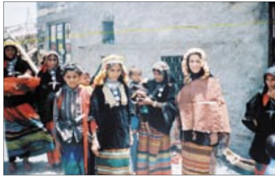
● الباحثة مع فتيات من منبه