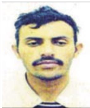
● قاسم الريمي

شرق اليمن. وهاجم الريمي القيادات العربية واتهمها بموالاة ما أسماها بالصهيوات الأمريكية. وقال في شريط فيديو مسجل استعرضه ممثل المدعي العام اليوم أمام هيئة المحكمة: "لن نضع سلاحنا عن عاتقنا حتى تسقط رؤوسنا عن رقابنا، وحتى نثار لدينا وإخواننا، متحدثاً عن مقتل فواز الربيعي قائلاً: "إن كان ألماناً فراق أخينا "فواز الربيعي" فقد أسعدنا -والله- نباته، واستشهاده، وإن كان أفجعنا -فوالله- أشعل براكين الانتقام لمقتله ومقتل شيخنا أبو علي الحارثي".