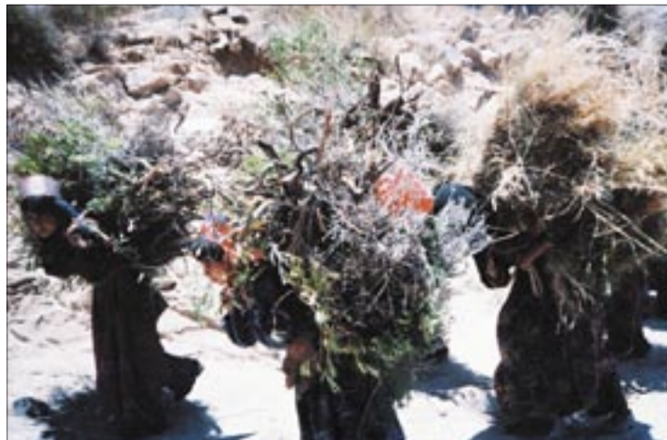
● خطابات من مجز

رازح.. خبيرني، هل الشباب تطهروا قبل عرسهم؟ وكيف المدرمة (زامل حماسي يقوله الختين؟) ماذا عن الحديد على الحديد ونار الله الوقيد واختن ياختان بالشفرة والهندوان سلامتكم... ولتبدأ زغاريد الختان، ونثر النقود والحلوى وحيا على الرقص، حيا على الرقص،