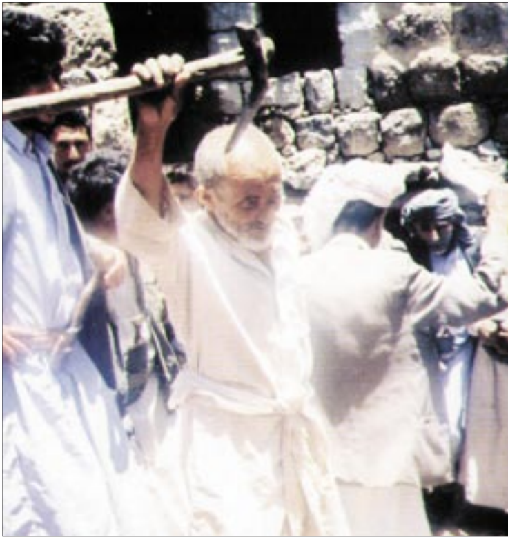
● رقصة البرقع.. من قلب قلعة حُرم - جبال رازح - صعدة